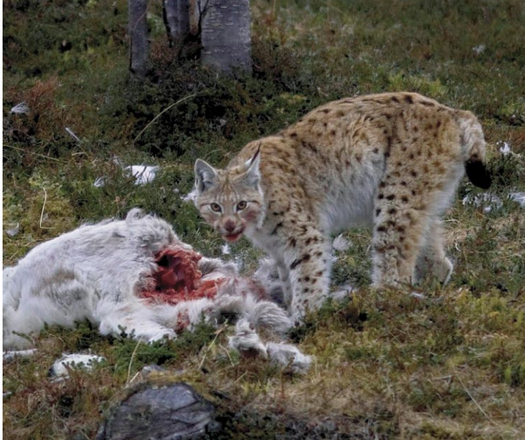
Lodjur på nyslagen ren.

Om järven har möjlighet att skrämra bort lodjuret från dess byte eller konsumerar bety-